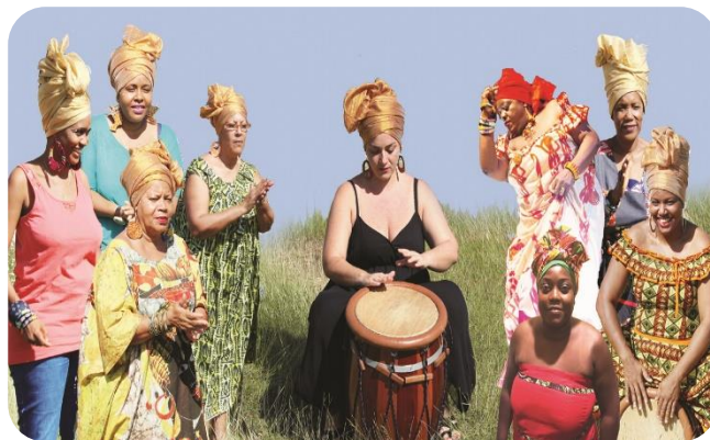
FANM KI KA