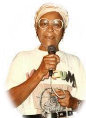
AKSIDAN (chantèz bèlè)