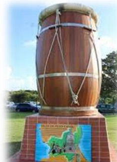
FONDAL KA- Sit Dival tikannal